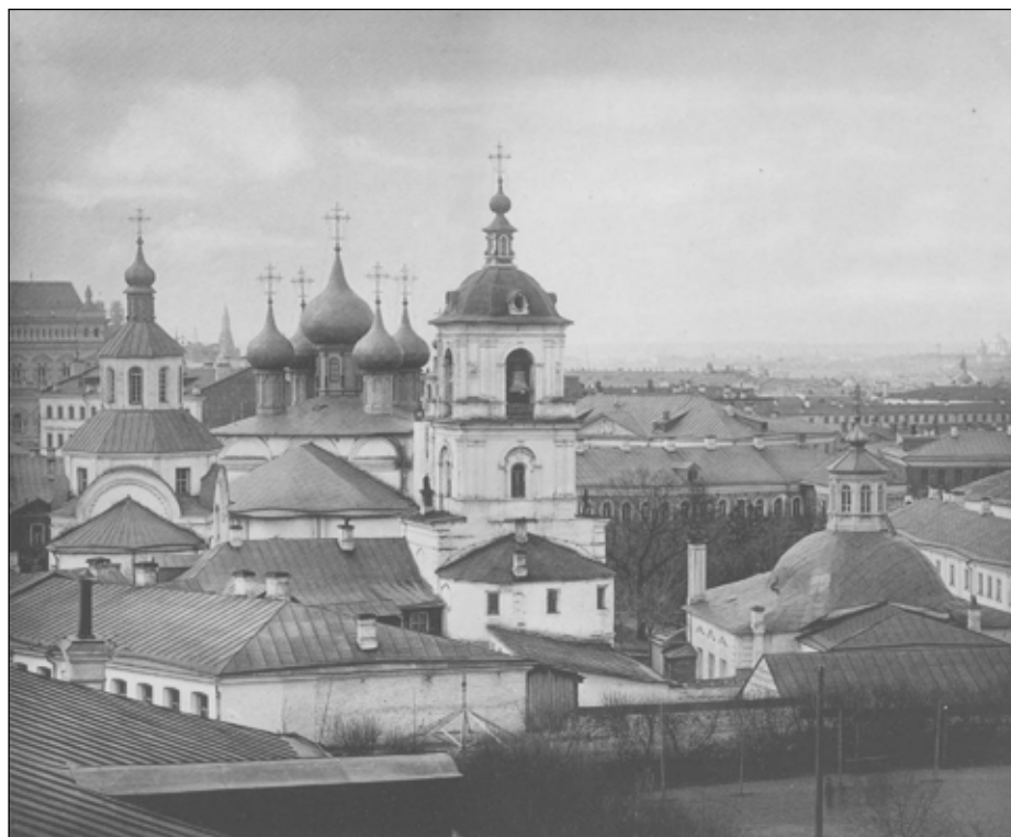
Вид Златоустовского монастыря. Год????

Конференция была посвящена изучению и возрождению московского Златоустовского монастыря. О ранее состоявшихся подобных мероприятиях «Московский журнал» писал 2012 (№1) и в 2014 (№9) годах. Участники нынешнего стремились по возможности всесторонне охватить многообразную проблематику, связанную с историей этой древней обители. Круг ор-