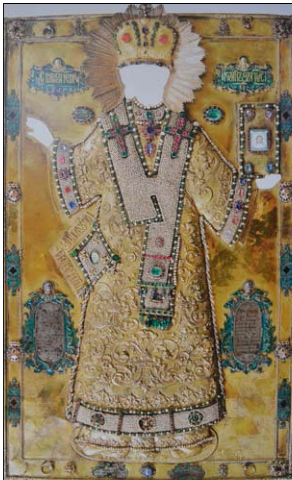
Оклад иконы-мощевика «Иоанн Златоуст». 1750 год. Венец и митра — 1819 год. Серебро, золото, рубины, изумруды, жемчуг, альмандины, сапфиры, бриллианты, аметисты, турмалины, стекла; чеканка, прозрачная эмаль, живописная эмаль, гравировка, золочение

стовского монастыря в XVIII–XIX веках»). Она воссоздала очень колоритный «социальный портрет» тамошней братии в разные эпохи — монашеское и мирское имя, сведения о происхождении, месте рождения, возрасте, принятии монашеского пострига и местах предшествующего и последующего служения, послушания и другие персональные данные. В докладе были подвергнуты анализу различные аспекты внутренней жизни монастыря. Эти сведения в значительной степени могут заполнить лакуны, имеющиеся в самом основательном труде по его истории — «Описании...» архимандрита Григория (М., 1914).