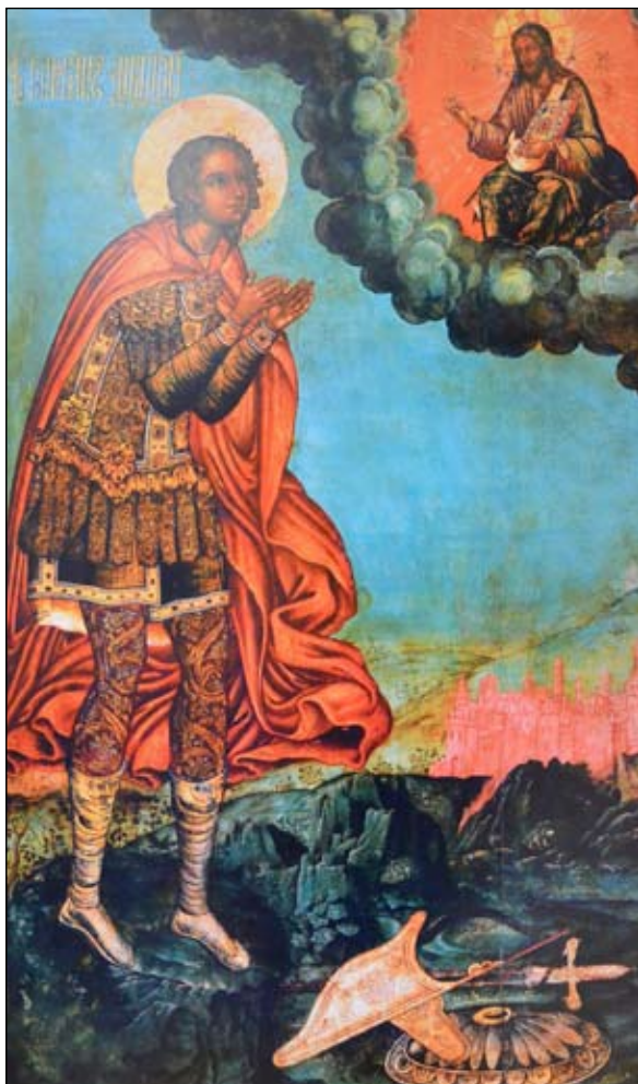
Образ Дмитрия Солунского из иконостаса соборной церкви Иоанна Златоуста в Златоустовском монастыре. 1700 год. Школа Оружейной палаты. Доска липовая, левкас, яичная темпера