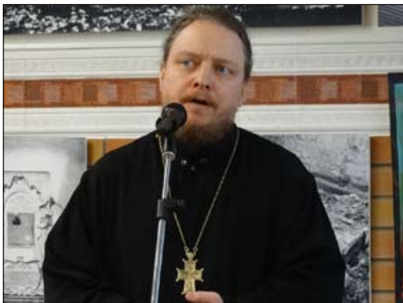
Протоиерей Федор Бородин